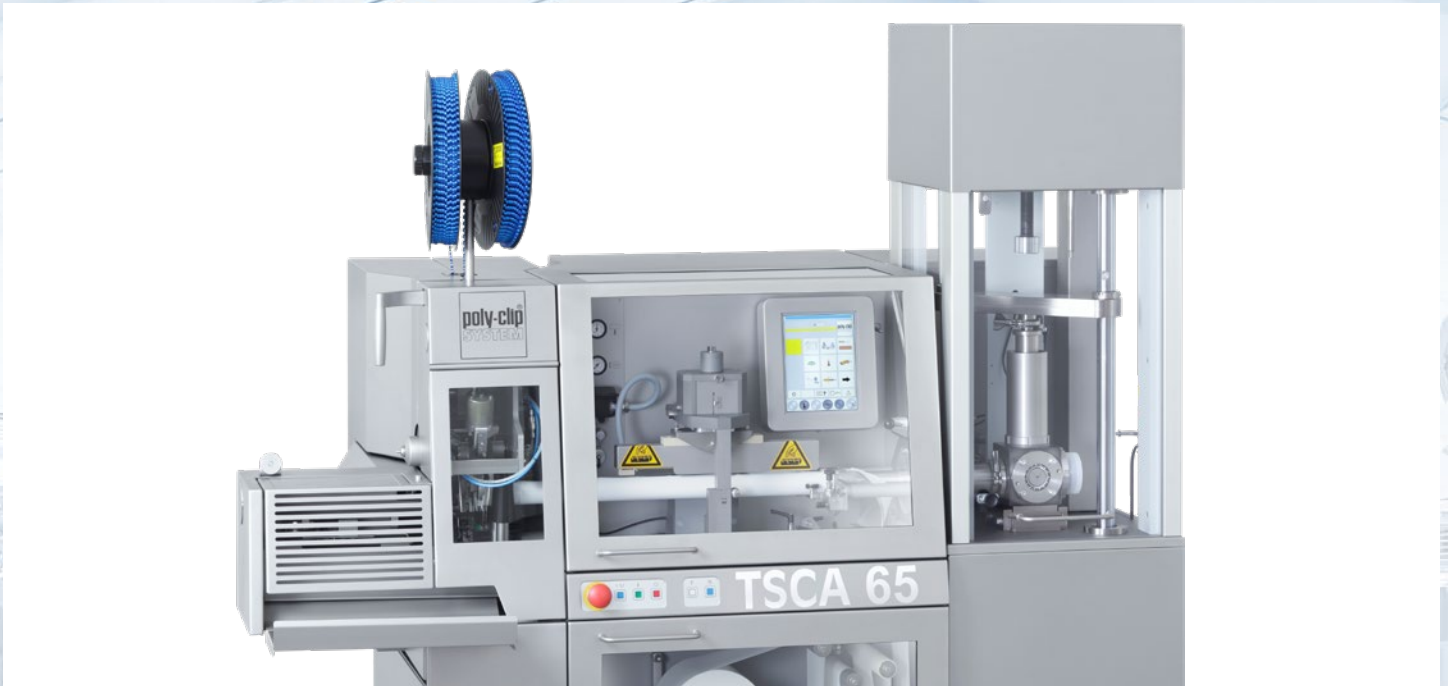
TSCA 65 D mit HDP 40 (hydraulische Dosier-Pumpe) im Einsatzbereich Dicht- und Klebstoffe bis Durchmesser 65 mm

farblich unterschiedenen Ebenen durch Zugangscodes gesichert. Die eigentliche Bedienung erfolgt über die fünf Taster der Bedienleiste. Die Folienrolle wird auf einen selbstspannenden Rollenträger aufgesteckt. Für gleichbleibende Einlaufspannung beim Folienabzug sorgt die Führung über ein Tänzerwalzensystem. Durch die Formschulter wird die Flachfolie um das Füllrohr zum noch offenen Schlauch gelegt. Anschließend wird die Längsnaht mit minimaler Überlappung durch Heißsiegelung verbunden. Um einen Produktrücklauf zu verhindern, ist das Ende des Füllrohres durch einen Innenkaliberring zum Schlauch hin abgedichtet, so dass auch flüssige Produkte gewichtsgenau gefüllt werden können.