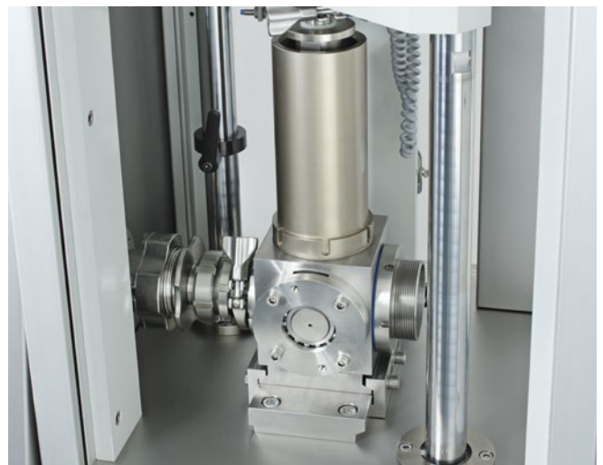
Volumetrische Dosierung der HDP – hohe Füllmengengenauigkeit

mittelechte Sicherheitsbeschichtung, überprüft durch das SGS INSTITUT FRESENIUS, eine störungsfreie Produktion und ggf. eine zweifelsfreie Produkthaftung. Poly-clip System ist der weltweit führende Anbieter von Clip-System-Lösungen.