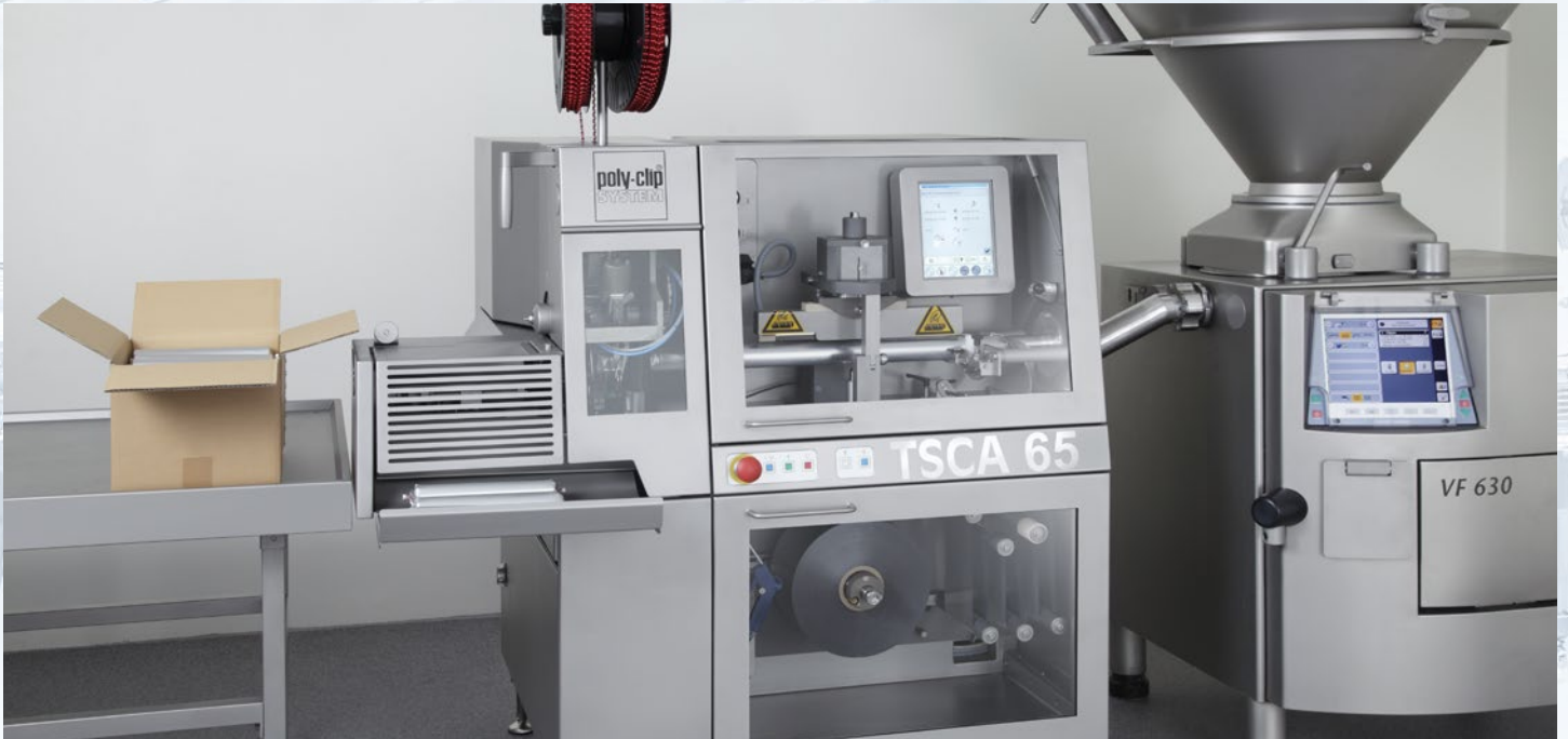
Rationelle Verpackung von z. B. Kleb-, Dicht- und Sprengstoffen mit dem TSCA 65 D