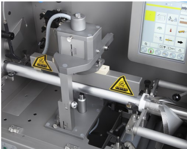
Heißsiegelstation des TSCA 65 D