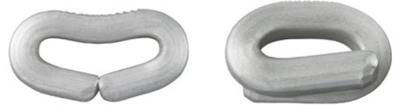
W-Verschluss für Naturdarm, V-Verschluss für Kunststoff- und Naturdarm

Die Clipmaschine SCH wird manuell betätigt. Die Bedienung ist problemlos und erfordert keinen großen Kraftaufwand. Über einen Handhebel wird die Rafferklappe geschlossen und der Clip gesetzt. Der überschüssige Darm- oder Beutelzopf kann mit dem integrierten Abschneidmesser entfernt werden.