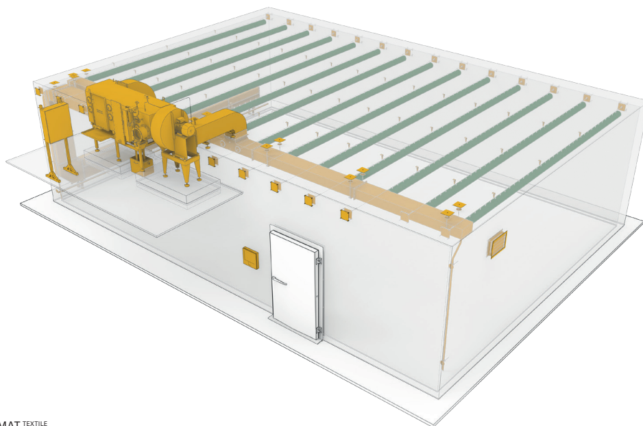
Abb.1 CLIMAMAT TEXTILE