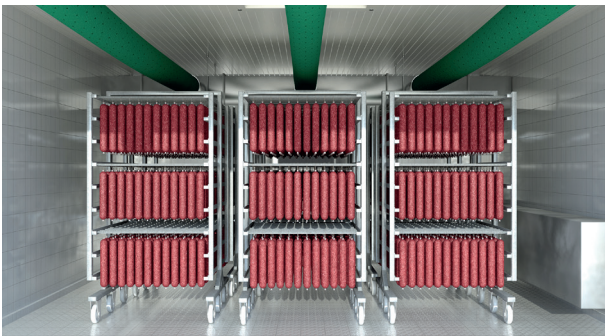
Abb.1 Luftführung Schlauchsystem - CLIMAMAT TEXTILE