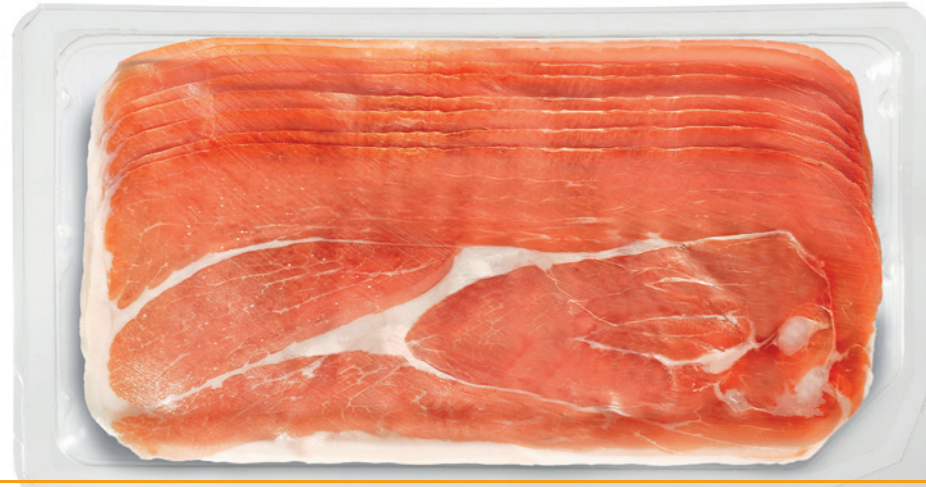
MAP (Modified Atmosphere Packaging) - Aufschnitt