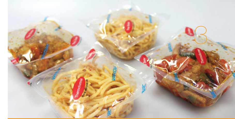
MAP (Modified Atmosphere Packaging) - Asia Food

Verpackungsleistungen von 13 Takten pro Minute bei brillanter Ausformung und bester Restfolienstärke werden mit der Optimus problemlos erreicht. Hartfolien bis zu 500 µ werden mit dem VARIOVAC RAPID AIR SYSTEM zu perfekten Schalen geformt.