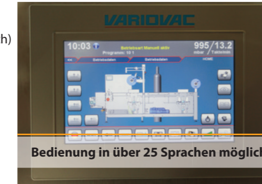
Bedienung in über 25 Sprachen möglich