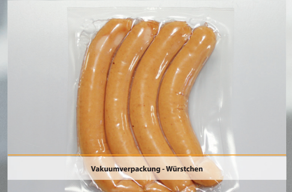
Vakuumpackung - Würstchen