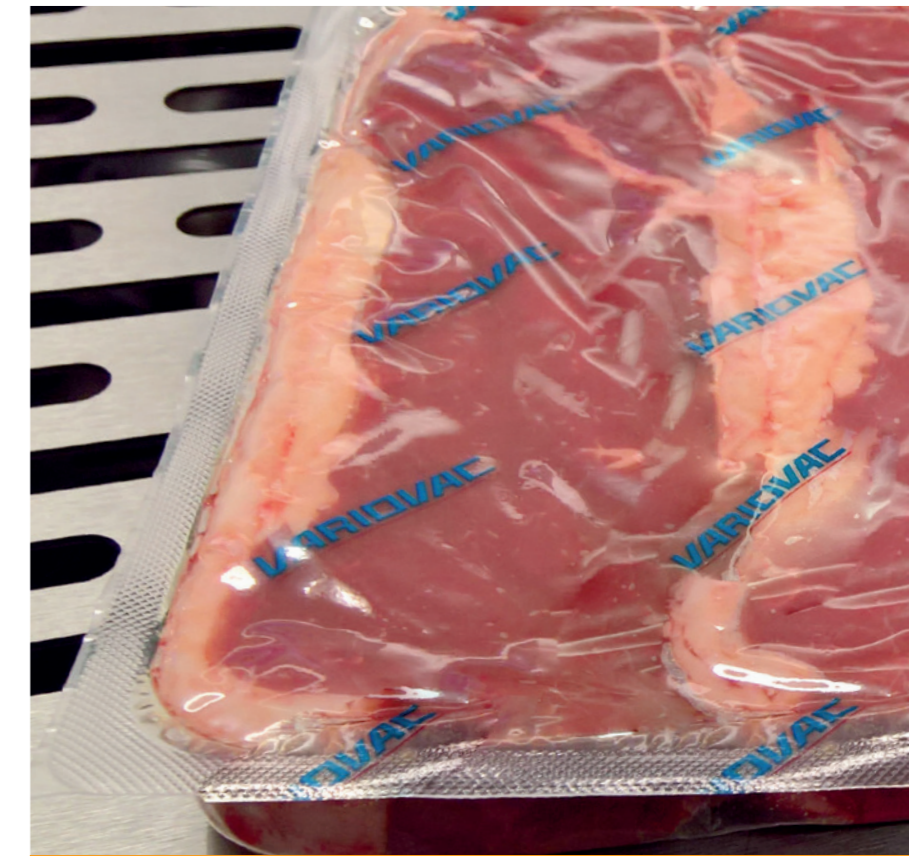
Vakuumverpackung - Steak