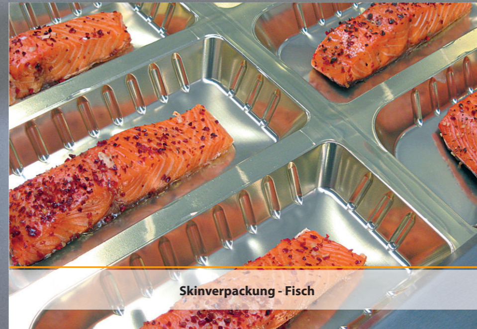
Skinverpackung - Fisch