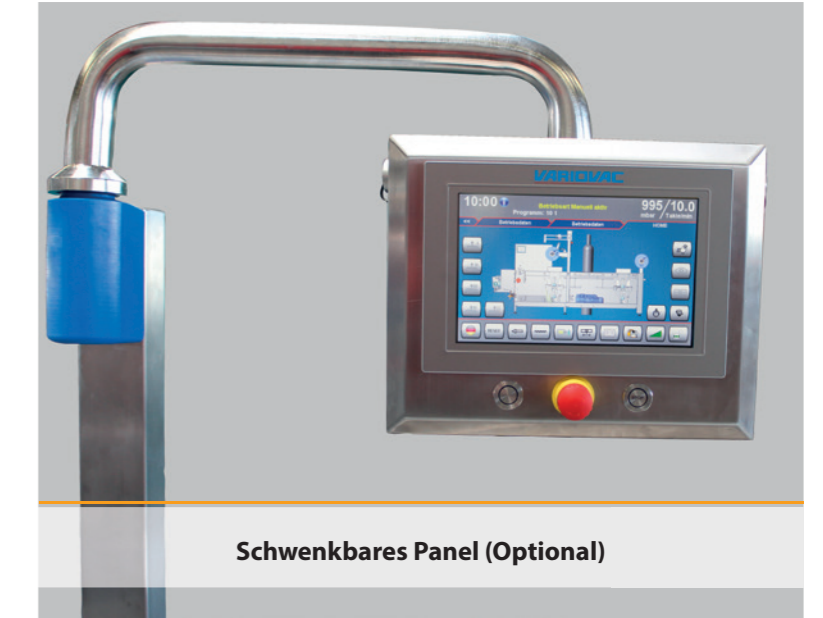
Schwenkbares Panel (Optional)