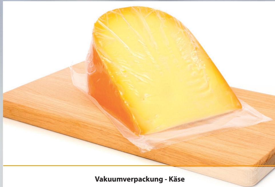
Vakuumverpackung - Käse