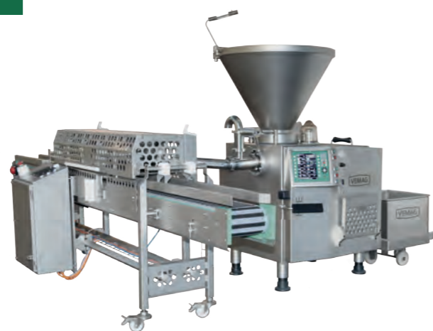
HPE - Walzenfüllkopf863