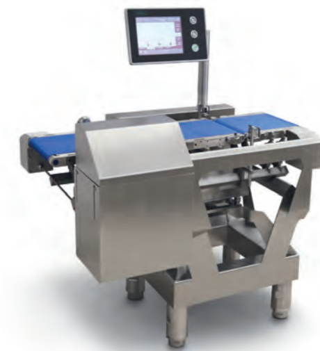
Process Check VPC715