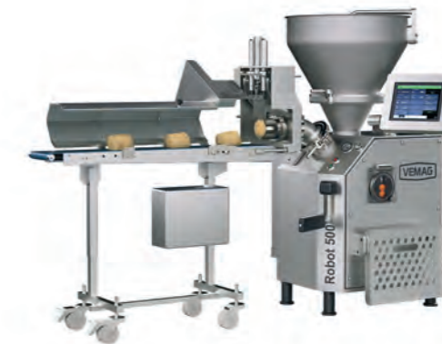
Robot 500 - ASV811