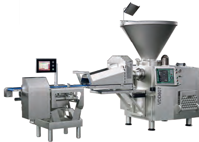
VDD807 - VPC715

Mit unseren Bäckereiliniien stehen Ihnen leistungsfähige und flexible Systeme zur Verfügung, die in Verbindung mit unseren Vorsatzgeräten und dem Zubehör eine große Produktvielfalt ermöglichen und selbst komplexe Produktionsprozesse effizient unterstützen.