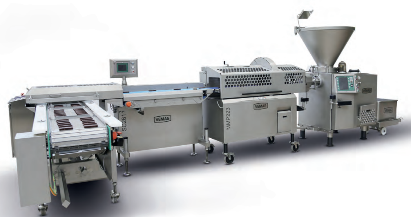
HPE - MMP223 - SC261 - Transportband

VEMAG Schießbänder sind in unterschiedlichen Längen erhältlich, lassen sich perfekt in unsere vielfältigen Produktionslinien integrieren und sind für verschiedenste Produkte geeignet. In hoher Geschwindigkeit legen sie Ihre Produkte in Transportrichtung der Verpackungsmaschine ab.