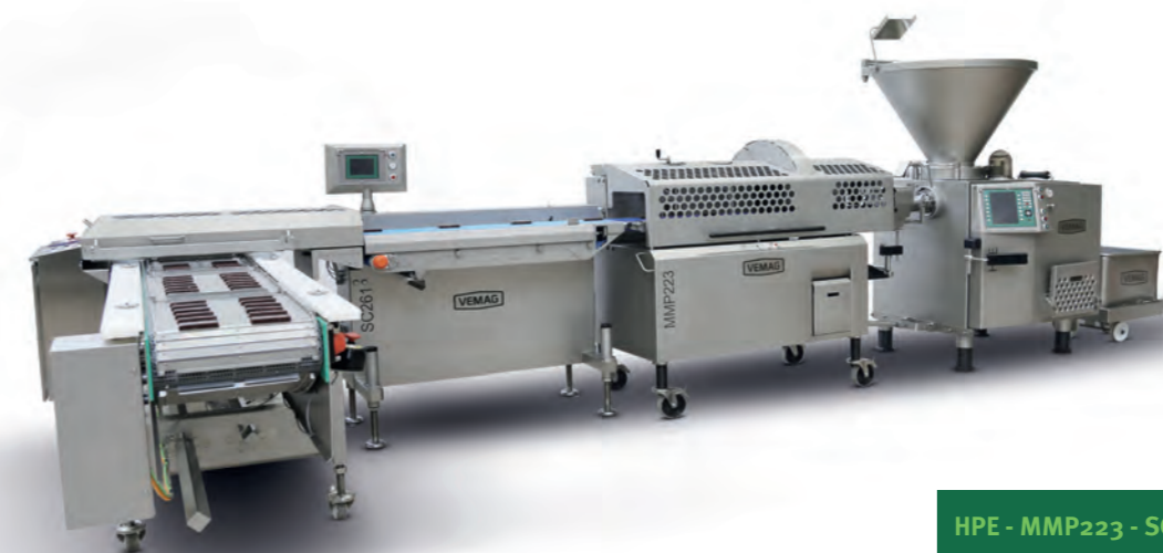
HPE - MMP223 - SC261