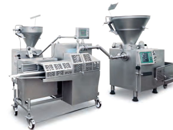
HPE - Servocrimper