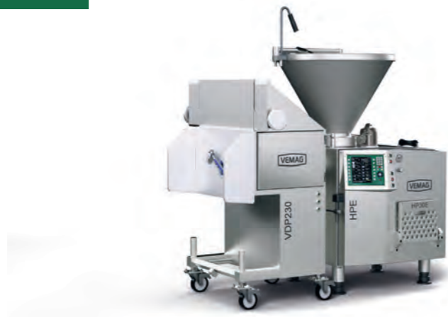
HPE - VDP230