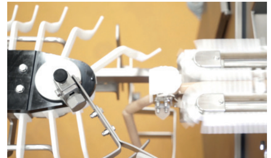
Übergabe LPG218 an AH219